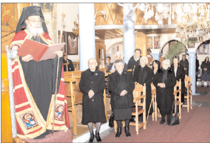
Στιγμιότυπο από τον εορτασμό των Εισοδίων της Θεοτόκου στο Παγονέρι, Κ. Νευροκοπίου.

χωριό του Παγονερίου, χρονολογείται από το 1835, και αποτελεί τον παλαιότερο ναό στο λεκανοπέδιο του Νευροκοπίου. Κατά τον εορτασμό των Εισοδίων της Θεοτόκου, στο Παγονέρι, προσήλθε πλήθος πιστών, με περισσότερα από 300 άτομα που βρέθηκαν στο χωριό, από τη Δράμα, τον Βώλακα, και το Νευροκόπι.